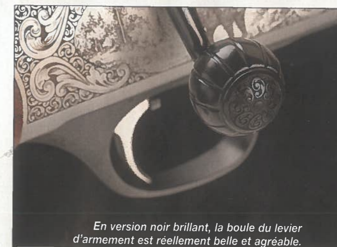
En version noir brillant, la boule du levier d'armement est réellement belle et agréable.

plus sexy encore et digne de celle de Marilyn Monroe dans le film éponyme, les changements ont tous été pensés sous un angle pratique et fonctionnel avant tout. Tous sauf la gravure, car il fallait tout de même un signe distinctif fort entre les deux générations. Sur le modèle Deluxe que nous avons testé, la finition vieil argent du boîtier est si réussie que l'on imagine avoir affaire à une pièce d'acier. Il n'en est rien, ce boîtier ouvert est tiré d'un bloc de Fortal, un alliage aéronautique utilisé par Chapuis Armes depuis le lancement de l'express superposé S12 en 2013. Ce boîtier a reçu une nouvelle gravure, encore plus belle que les précédentes,