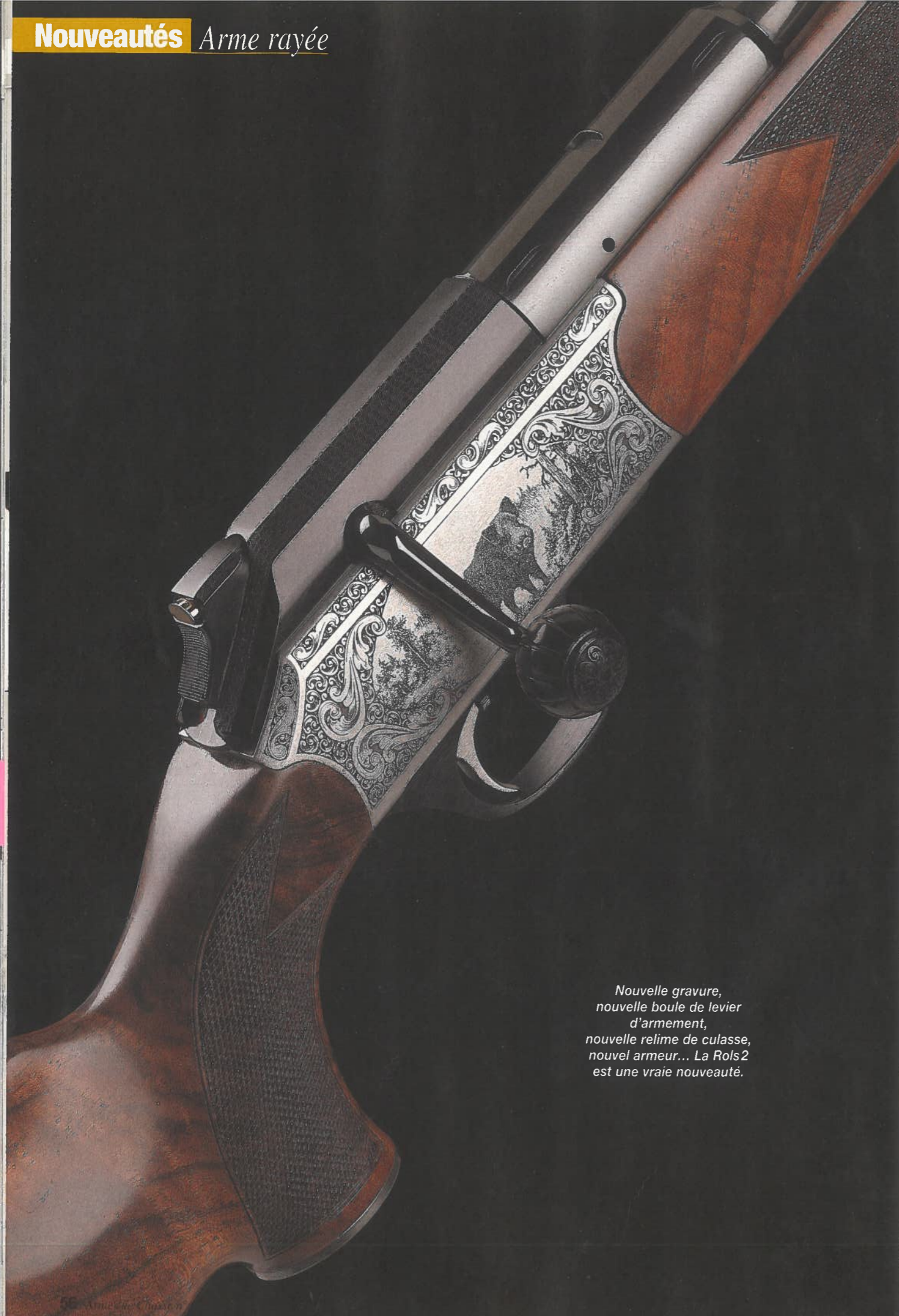
Nouvelle gravure, nouvelle boule de levier d'armement, nouvelle relime de culasse, nouvel armeer... La Rols 2 est une vraie nouveauté.